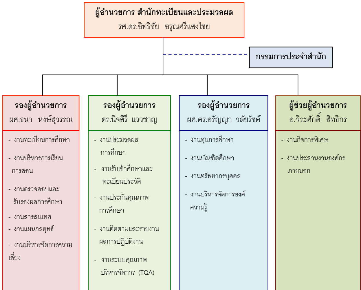
แผนภูมิที่ 1 : โครงสร้างการบริหารงานของสำนักทะเบียนและประมวลผล

สำนักทะเบียนและประมวลผล สถาบันเทคโนโลยีพระจอมเกล้าเจ้าคุณทหารลาดกระบัง มีโครงสร้างการบริหารงาน ดังแผนภูมิที่ 1 และ แผนภูมิโครงสร้างการแบ่งส่วนงาน ดังแผนภูมิที่ 2